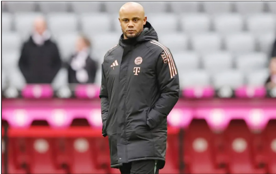
Vincent Kompany, entrenador del Bayern Munich.

Además, aseguró que es difícil "imaginar toda la competición cuando es la primera vez" y cree que será una ventaja "jugar un partido competitivo contra Boca". Y añadió: "Creo que eso en sí mismo es emocionante, ver a algunas de las mejores aficiones del mundo: la nuestra y la suya".