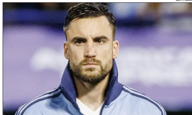
Nicolás Tagliafico, el otro campeón del mundo que River buscará seducir.

decisión, algo que bajaría su rendimiento como jugador y que lo conduce a descartar a los clubes locales. "Siento que hoy el fútbol argentino