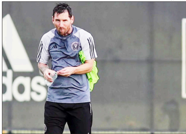
Lionel Messi volvió a los entrenamientos con Inter Miami tras su lesión en la Copa América.

Vale recordar que el campeón del Mundo en Qatar 2022 y bicampeón de América con la selección argentina tuvo que usar una bota ortopédica en su tobillo durante algunos días, la